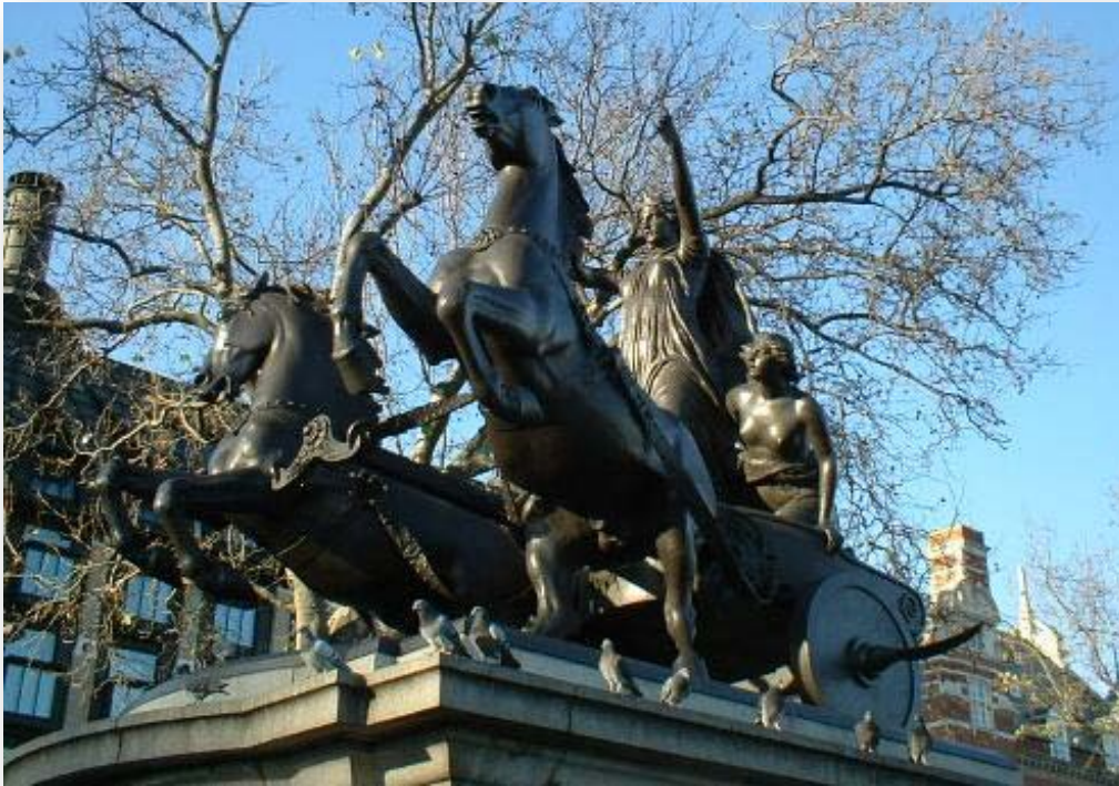
Boadicea standing near Westminster Pier in London