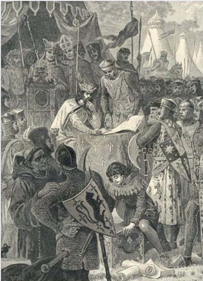
King John of England signs Magna Carta with his seal.

It was a document which King John was forced to sign by the English barons (lords) in 1215 .