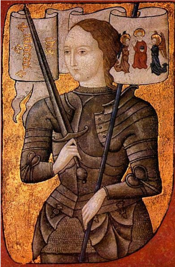
Joan of Arc (c.1450-1500)