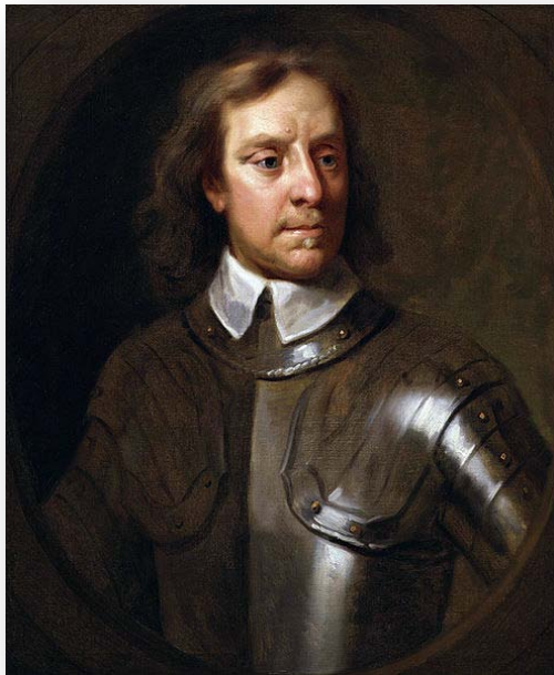
Oliver Cromwell Lord Protector

They wore simple dark clothes and cut their hair short ( Roundheads ).