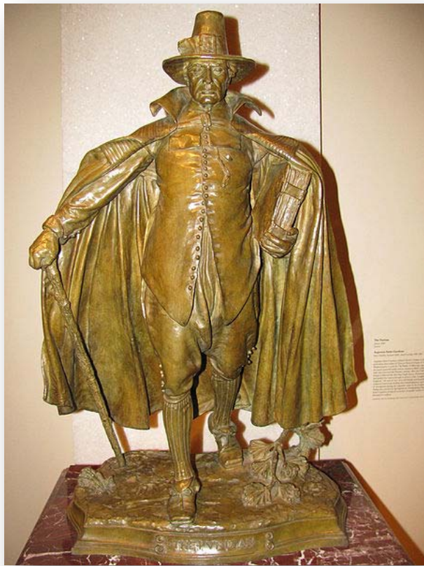
A typical Puritan

Puritans were English Protestants in the 16th – 17th centuries.