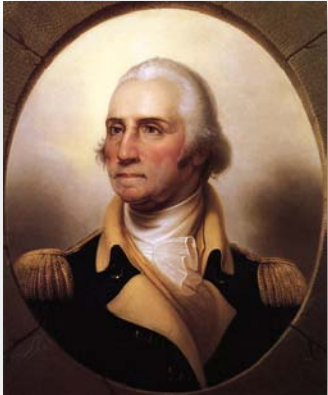
George Washington The commander of American Army. The first American president

It began as a war between the Kingdom of Great Britain and the thirteen colonies in America.