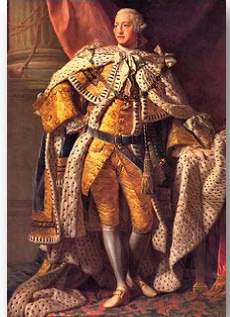
George III British King

France, Spain and the Dutch Republic all secretly provided supplies and weapons to the Americans.